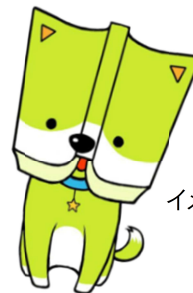
イメージキャラクター 「アディ★」